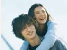
©2020「きみの瞳が問いかけている」製作委員会 ©2020 Gaga Corporation/AMUSE, Inc./Lawson Entertainment, Inc.

不慮の事故で家族と視力を失った女性とキックボクサーとして将来を有望視されていたものの、ある事件をきっかけに心を閉ざした青年。女性の失明に自分の過去が関係していることを知り、彼女の目の手術代を稼ぐため、青年は不法な賭博試合のリングに立つことを決意する。障害者の生き方やかわり方などについて考えてみませんか。